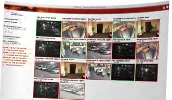
Interface de levée de doute

Véritable outil dédié au responsable sécurité, le monitoring centralise toutes les remontées d'alarmes en temps réel. Accédez aux photos, clips vidéos, alertes sonores, filtres de sélections, d'un simple clic et acquittez vos levées de doutes.