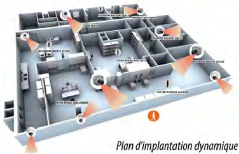
Plan d'implantation dynamique

Accédez aux caméras et visualisez vos alarmes à partir des plans d'implantation de vos installations.